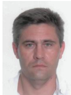
Борис ЛУК'ЯНЧИКОВ © кандидат юридичних наук, доцент (Національний технічний університет України «Київський політехнічний інститут імені Ігоря Сікорського», м. Київ, Україна)