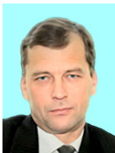
Олег ПОПЛАВСЬКИЙ © кандидат історичних наук, доцент (Дніпровський державний аграрно-економічний університет)

УДК 355.433:355.018:355.014 DOI 10.31733/2078-3566-2021-1-61-71